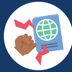
Pagbanta kaugnay sa katayuan sa imigrasyon