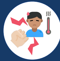
Disiplina, kasama ang paggamit ng nabayaranang sick leave

Sa California, kung sa tingin mo nilabag ang iyong karapatan sa pinagtrabahuan at ikaw ay nagsagawa ng aksyon o nagsalita tungkol dito, ang iyong amo ay hindi maaaring magparusa sa iyo sa paggamit ng iyong karapatan. Ito ay tinatawag na pagganti, at ito ay ilegal.