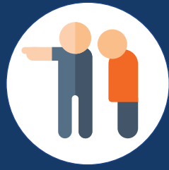
Terminasyon, demosyon, o suspensyon