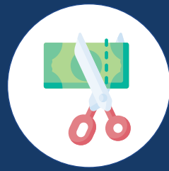
Pagbawas sa oras o bayad